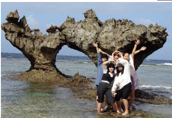
嵐のCMでを使用した古宇利島で記念写真

3日目は、那覇市内班別自由研修。国際通りを中心に買い物をしたり写真を撮ったりして、それぞれで楽しい時間を過ごしました。